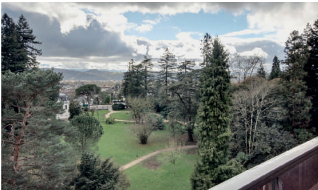
Pau bénéficie du dispositif Denormandie dans l'ancien jusqu'au 31 décembre 2022.